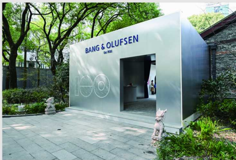
“百年拂声”100 周年全球首展现场