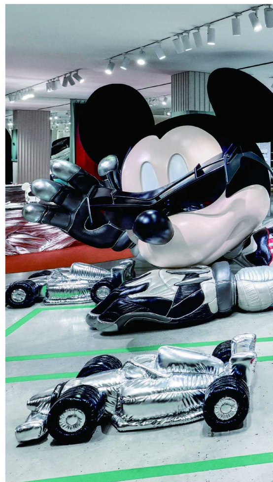
GENTLE MONSTER 全新限时联名空间

从巨型装置到沉浸式场景，GENTLE MONSTER 一直擅长将产品发布转化为一次公共艺术体验。这样的空间不仅是新品展示的舞台，也成为城市文化景观的一部分，吸引着越来越多年轻人前来探索和分享。