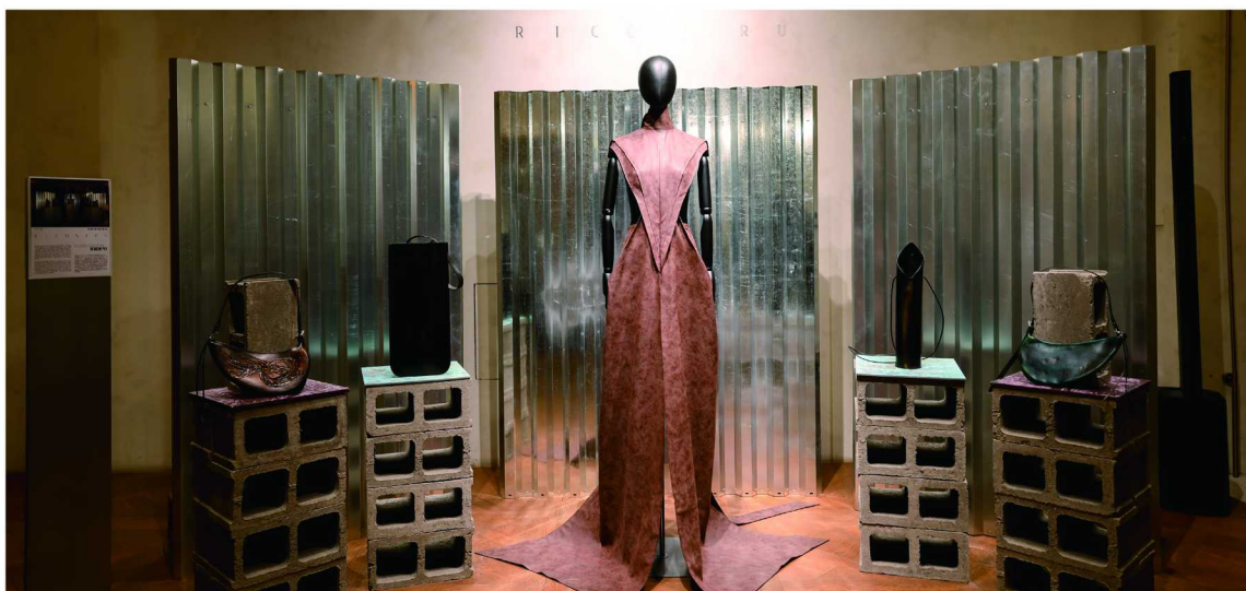
Design in the City 2026 设计漫游项目 - 时尚品牌 RICOSTRU 重建古道系列巡展

有时候，艺术与设计并不只存在于展馆之中。它们可能出现在一条梧桐掩映的街道上，也可能藏在一间品牌空间或一栋历史建筑里。随着越来越多创意项目走出传统展厅，城市本身也逐渐成为一座开放的美术馆，当你在街区漫步、逛店或周末出行时，便能与设计艺术不期而遇。