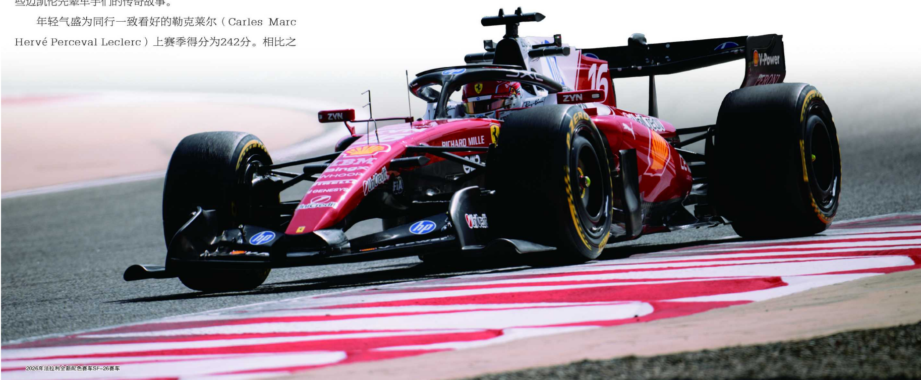
2026年法拉利全新配色赛车SF-26赛车

在试车过程中新赛车以黑银配色示人，隐藏设计细节之余展现科技感，象征从零开始的态度。而正式亮相后则已黑色配其标志性的木瓜橙色，这是迈凯伦自1960年代便使用的标志性颜色，延续这一配色有助于强化品牌识别度，代表品牌传承与自信。迈凯伦在赛前试车时创下了最快速度纪录，这本身就意味着车队不惧规则的变化，已经做好了蝉联双冠的准备。