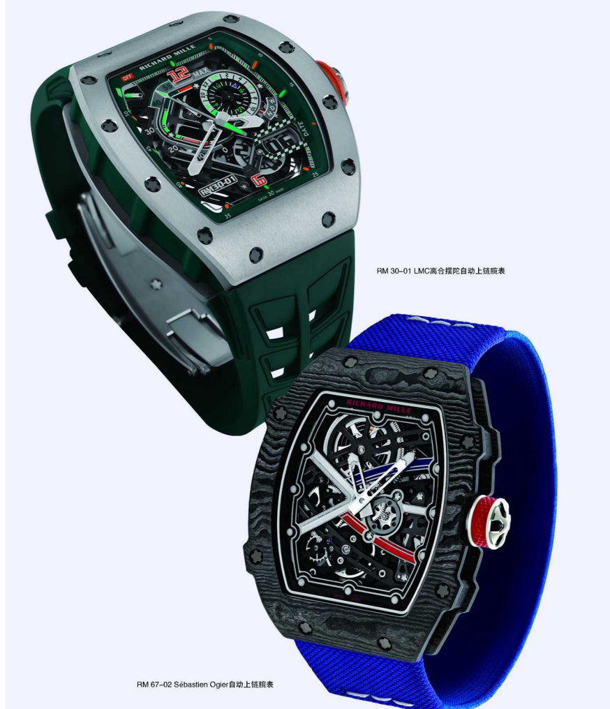
RM 30-01 LMC高合陀飞轮自动上链腕表

赛车DNA深藏于品牌的血脉深处，它促使品牌一直紧盯着未来的无限可能性，不断地开拓着前人未曾涉足的新领域。