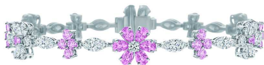
HARRY WINSTON Forget-Me-Not 粉色蓝宝石和钻石手链