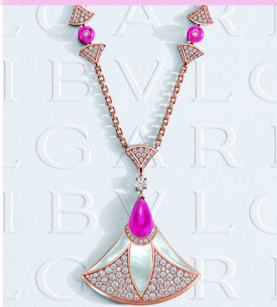
BVLGARI Divas' Dream 系列珠宝作品

宝格丽 Bvlgari Divas' Dream 系列就通过色彩组合，展现了典型的意式美学。标志性的扇形设计灵感源自古罗马建筑中的马赛克图案，并被赋予了更加丰富的色彩表达。珍珠母贝花瓣在光线下散发温润光泽，与