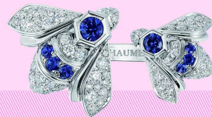
CHAUMET Bee de Chaumet 系列戒指

密镶钻石形成细腻对比，而红碧玺的点缀则为整体设计增添一抹鲜明亮点。镂空设计的项链以钻石扇形为基础，在中央镶嵌水滴形坦桑石、绿碧玺或红碧玺，让彩色宝石成为视觉焦点，在简洁结构中形成富有层次的光影效果。