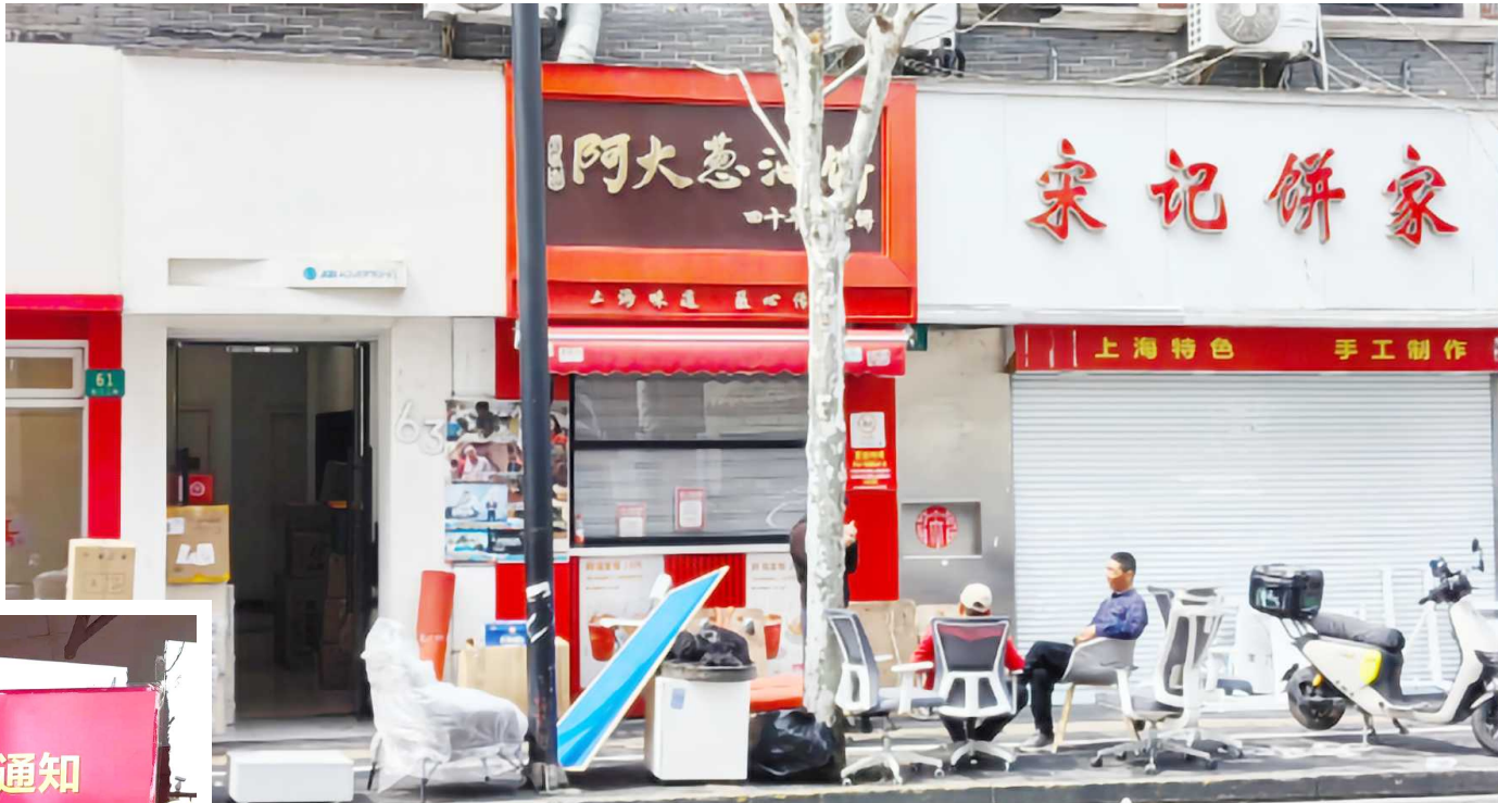
4月1日中午，“阿大葱油饼”门口有楼宇内公司的办公用品和打包好的箱子

那么，“阿大葱油饼”门店在过去一年当中经营情况如何？后续是否还会有新的开店计划？记者就此进行了采访。