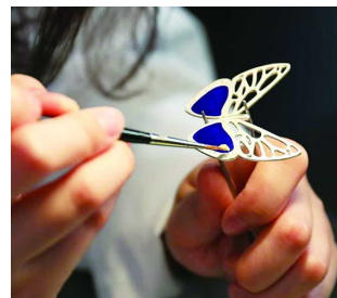
“珠宝和‘大明火’珐琅”课程