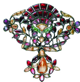
吊坠,18世纪,巴黎装饰艺术博物馆