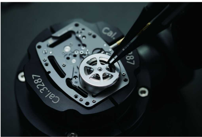
品牌自主研发的CRMA2自动机芯