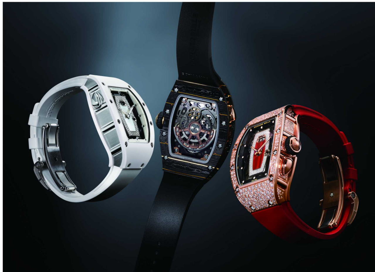
RM 037自动上链腕表系列