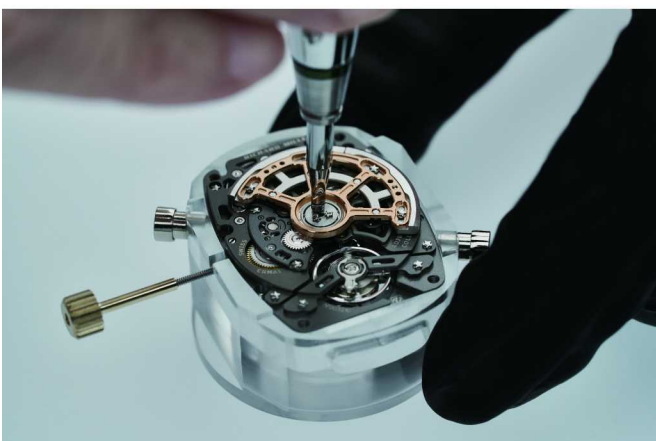
品牌首款CRMA1镂空自动上链机芯