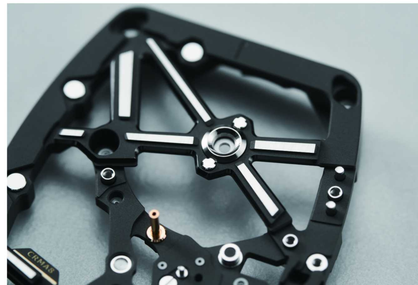
RM 07-04所采用的微喷砂网格支撑机芯结构

这款腕表不仅搭载了品牌自主研发的镂空自动机芯，更具备超高的耐用性，以其5,000g的抗冲击能力，展示了品牌在这个领域的突破。其机芯完全由一个微喷砂网格支撑，这种创新结构在制表行业中堪称独树一帜，完美应对了航空腕表的严苛需求。从自主机芯的诚意，到色彩美学的完整表达，再到专为运动场景而生的高性能腕表，品牌的女表谱系并非线性叠加，而是在不断拓宽“她”的腕上疆域。而真正让这些机械拥有体温 and 故事的，是那群与品牌彼此照亮的女性。