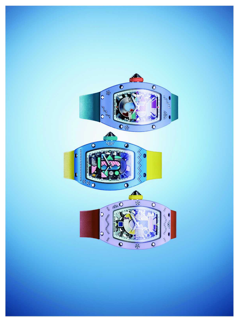
RM 07-01 彩色陶瓷系列

比高达40%，这在同级别制表品牌中极为罕见。业内观察者指出，这正是近年来最值得关注的产业信号——现代女性早已不满足于佩戴带有男性痕迹的大尺寸表款，她们愿意为更精巧、更舒适且自主研发的女表投入可观的预算。而RICHARD MILLE理查米尔对于女性腕表的投入、与女性挚友日益紧密的共创关系，也在不断拉近品牌与女性消费者之间的心理距离，让更多腕表进入她们的“愿望清单”。当女表不再只是锦上添花的支线，而成为驱动增长的强劲引擎，产品推新自然被赋予了更多的期待。