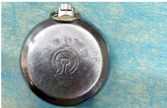
上海铁路局发给司机的怀表

展馆内,描绘清朝时火车站场景的画作、民国时期铁路纪念章、建国后铁路运动会奖章、铁路老地图、历年列车时刻表