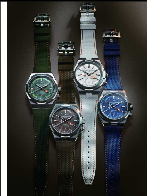
Overseas 纵横四海系列四方之境两地时间腕表