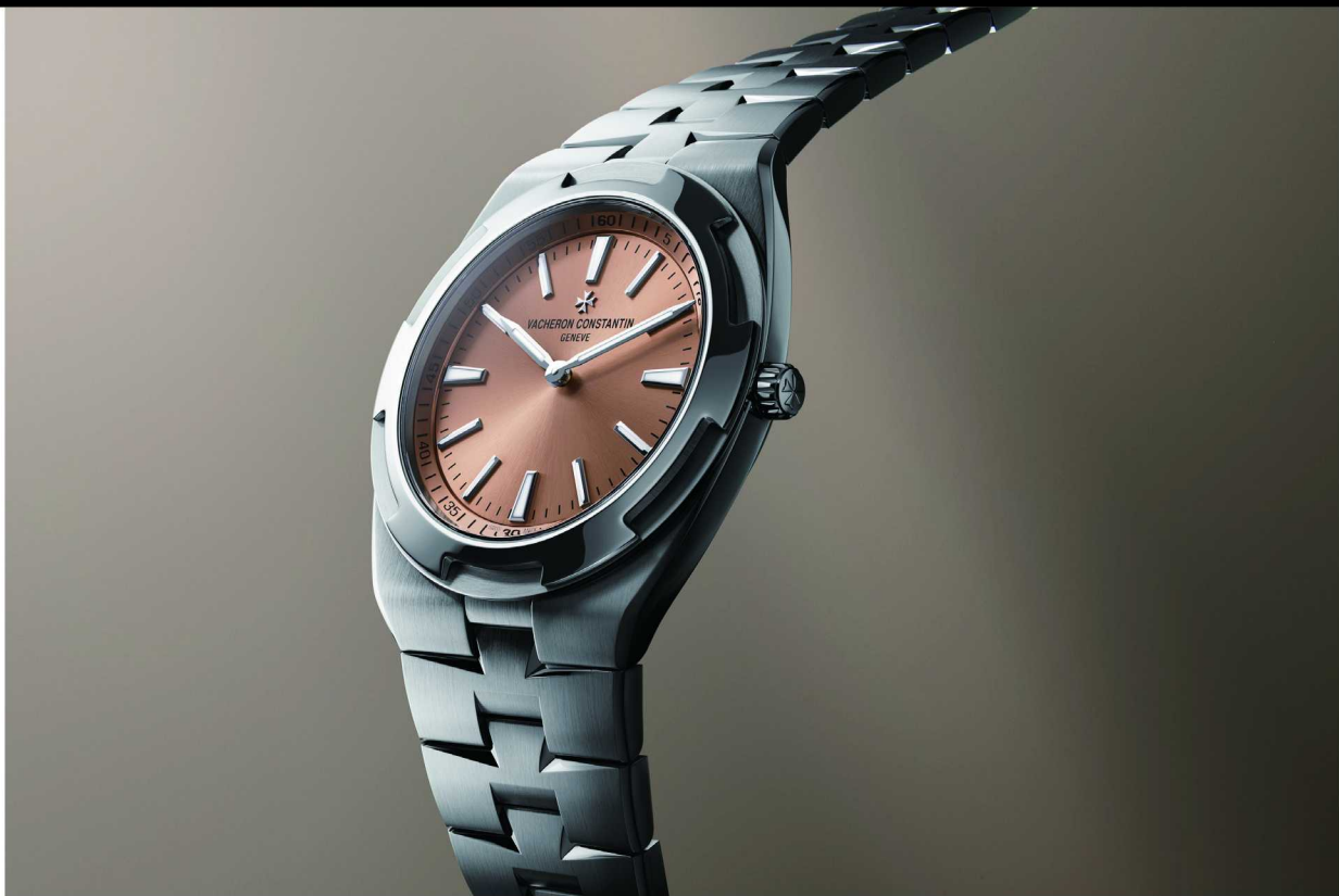
Overseas 纵横四海系列超薄自动上链腕表

从2019年与卢浮宫正式建立艺术与文化合作伙伴关系，到2022年推出首批“致敬伟大文明”腕表，再到La Quête du Temps 寻迹时光座钟于卢浮宫首度亮相，江诗丹顿与卢浮宫之间的合作，已经不只是一次单独的艺术项目，而是一条持续展开的文化线索。它让高级制表不只面对机械，也面对历史，不只面对当下，也面对那些曾经塑造人类文明的图像、技艺与信念。