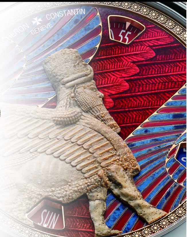
左: La Quête du Temps 寻迹时光座钟 中: MÉTIERS D' ART 艺术大师系列“致敬伟大文明”腕表——维莱特里的雅典娜 右: MÉTIERS D' ART 艺术大师系列“致敬伟大文明”腕表——萨尔贡二世的拉玛苏神像