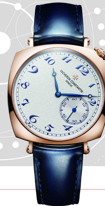
Historiques 历史名作系列 American 美国 1921 腕表

另一款今年推出的纵横四海系列超薄自动上链腕表，采用950铂金打造，搭载全新2550超薄自动上链机芯，机芯厚度仅2.4毫米。2550机芯的出现，其实很能说明这一系列今天的变化方向。它不再只是强调运动感或旅行属性，而是开始把高级制表对于比例、舒适性及佩戴状态的理解进一步融入其中。尤其在39.5毫米表径与7.35毫米厚度的整体比例之下，纵横四海系列原本偏向运动的轮廓，也呈现出更加克制、更接近正装腕表的气质。这种变化，并不是让它远离探索精神，而是让“探索”变得更加内敛，也更加贴近当代高级制表的审美趋势。