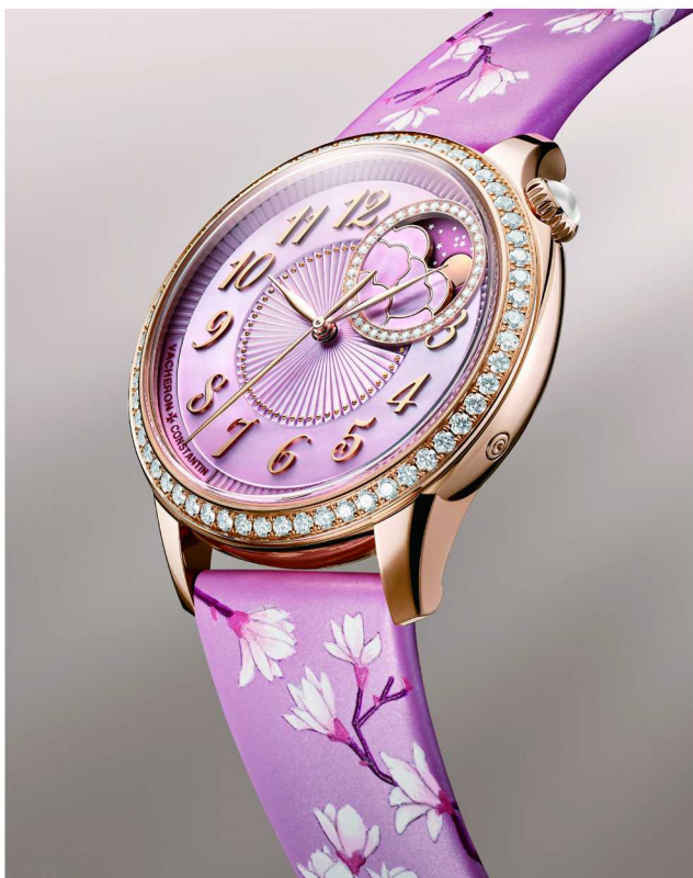
ÉGÉRIE 伊灵女神系列繁花春锦月相腕表

当人们回看江诗丹顿今年“钟表与奇迹”的整体呈现时，会发现品牌真正想表达的，或许并不是某一枚具体腕表，而是一种更加完整的高级制表观。探索并不只存在于技术突破之中，也存在于不同文化、不同审美与不同生活方式之间的不断延伸。而这些彼此不同的表达，也共同构成了江诗丹顿关于“时间边界”的完整图景。