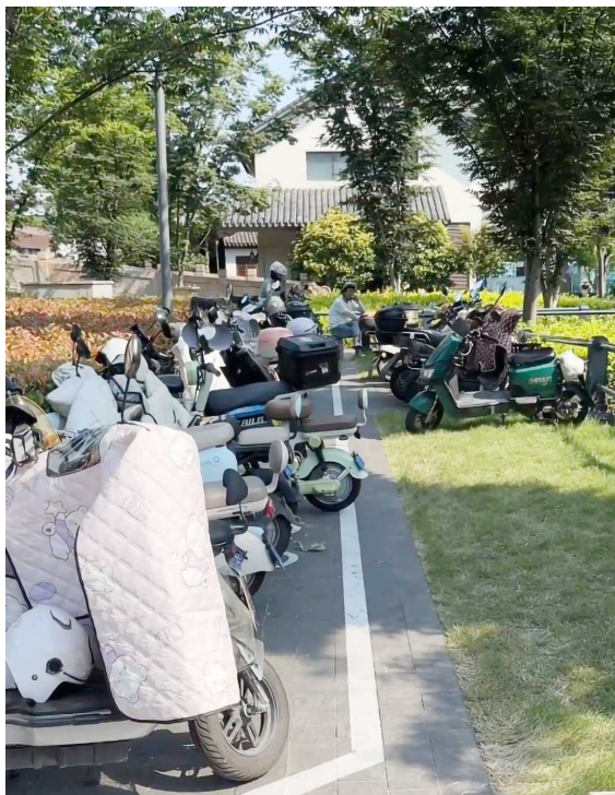
停车位直接划在了人行道上

但是，城市精细化治理的核心，从来不是“两害相权取其轻”的被动妥协，而是主动破局、精准施策，最大限度兼顾各方